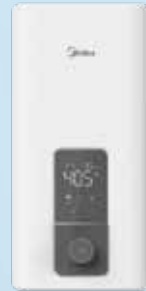
18kW 即熱式熱水爐 (型號：DFS180HK) 18kW Instant Electric Water Heater 美的電器 (香港) 有限公司 Midea Electric (HK) Limited