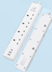
XPower PS4D 7 輸出 2 USB + 1 Type-C 4 頭拖板 XPower PS4D 7 Output 2 USB + 1 Type-C, 4 Sockets Power Strip 皇者國際貿易有限公司 XPOWER INTERNATIONAL TRADING LTD.