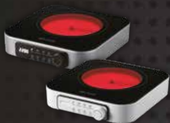
RC320S/W 2200W 單頭電陶爐