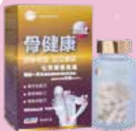
骨健康 Bone Fit

美國仁心仁術健康國際（香港）有限公司 USA L&H Health Int'l (HK) Limited