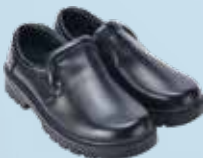
經典廚房鞋系列 Kitchen Shoes Series 偉豐鞋業有限公司 Well Fong Footwear Company Limited