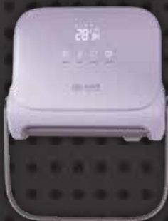
SFH111PG 移動式智能浴室寶