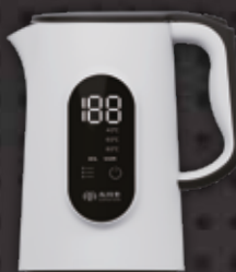
SKT180 智能保溫電熱水壺