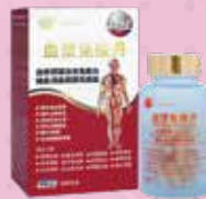
血漿免疫丹 Blood Plasma Immunity Pellet

美國仁心仁術健康國際（香港）有限公司 USA L&H Health Int'l (HK) Limited