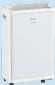
二合一空氣淨化抽濕機 (型號：MDD1-28L3D) 28L 2-in-1 Air Purifying Dehumidifier 美的電器 (香港) 有限公司 Midea Electric (HK) Limited