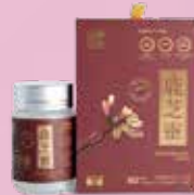
騰泰堂鹿芝靈 Gallop-Ganorhoceps Capsule 騰泰康世貿有限公司 Gallop Worldwide Limited