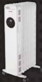
SOH1500T/SOH2000T 1500W/2000W 充油式電暖爐