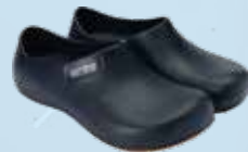
艾樂跑新一代超防滑舒適廚師鞋 ARRIBA New Style Chef Shoes 偉豐鞋業有限公司 Well Fong Footwear Company Limited