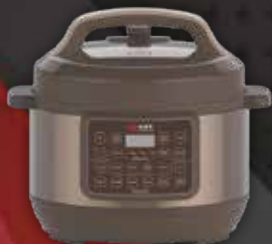
SMC601 6合1智能萬用高速鍋