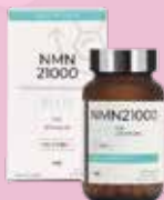
ELXR Lab NMN21000 PLUS 多匯妥有限公司 Trade In Limited

Goji Seed Oil Capsule 美國仁心仁術健康國際（香港）有限公司 USA L&H Health Int'l (HK) Limited