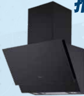
70cm 傾斜式煙囪抽油煙機 (型號：MCHC70J72) 70cm Inclined Chimney Range Hood 美的電器 (香港) 有限公司 Midea Electric (HK) Limited